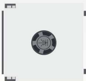
Pokrywa ryglowana PLb